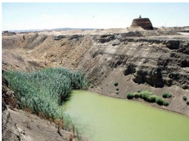
Foto izda.: Proyecto de replantación de especies vegetales en una antigua cantera de arcilla en Almansa. Foto dcha.: Foto: Cantera de arcilla rehabilitada en Pantoja (Toledo).

Las canteras de arcilla representan una oportunidad para la biodiversidad , creando o restaurando hábitats naturales que puedan dar cobijo a los animales y plantas del entorno.